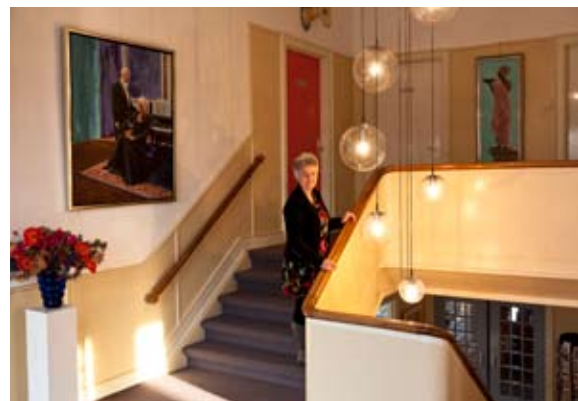
Boven: Het voormalige gemeentehuis is veranderd in een woning met galerie. Onder: Op Schiermonnikoog staan levensgrote kunstwerken op boerenerven, Theo Onnes beschilderde er silo's.

'Een uit de hand gelopen project,' noemt Onnes het beschilderen van een zestal silo's op Schiermonnikoog. Daar schilderde hij een koeienkop op een voersilo bij de