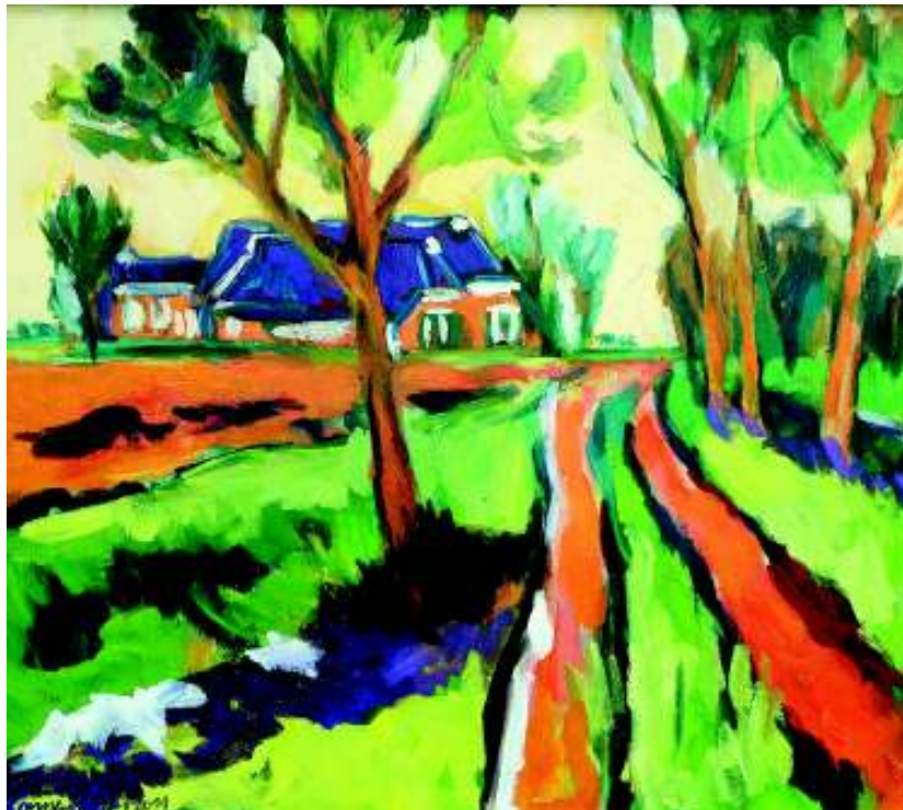
Groninger landschap (Antje Sonnenschein).