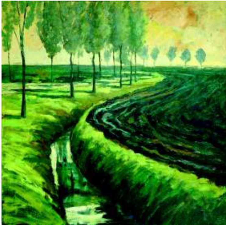
Westernieland (Theo Onnes).